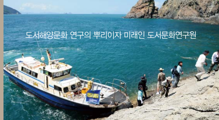
도서해양문화 연구의 뿌리이자 미래인 도서문화연구원