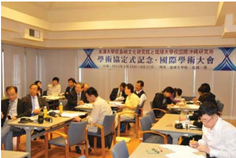
학술교류협정식 및 국제학술대회 (류큐대학교, 2011년)