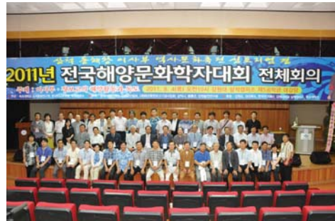
전국해양문화학자대회 (강원대 삼척캠퍼스, 2011년)