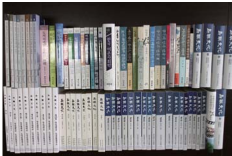
『도서문화』: 국내유일 도서해양문화 전문학술지